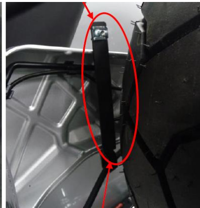
Halter und Gewindeklemme