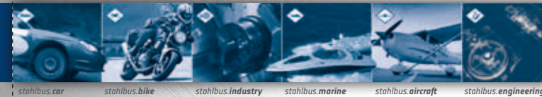
stahlbus.car stahlbus.bike stahlbus.industry stahlbus.marine stahlbus.aircraft stahlbus.engineering

Tel.: +49 (0) 2324 / 90 22 9 22 Fax: +49 (0) 2324 / 90 22 9 64 E-Mail: info@stahlbus.de Internet: www.stahlbus.com