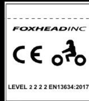
ПРИМЕР ЗА СЕ ЕТИКЕТ

Тези ботуши са предназначени за мотористи на офроуд мотоциклети. Ботушите МХ осигуряват защита срещу неблагоприятните условия на средата, без да ограничават прекалено физическите възможности на потребителя да управлява мотоциклета и да работи с крачните органи за управление. Те също така осигуряват известна механична защита за глезените в случай на злополука. Ботушите за мотокрос не са предназначени да осигуряват защита при падане вследствие на подхлъзвания. Тези ботуши са били подложени на изпитвания и са сертифицирани съобразно Европейски стандарт 13634:2017 (ниво 1 2 2 2)