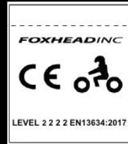
CONTOH LABEL CE

But ini direka bentuk untuk dipakai oleh penunggang motosikal di luar jalan raya. But MX ini bertujuan untuk memberi perlindungan daripada keadaan sekeliling tanpa menjejaskan ketangkasan pengguna dalam mengawal motosikal dan mengendalikan kawalan kaki. But ini bertujuan untuk memberi tahap perlindungan mekanikal pada pergelangan kaki dalam kemalangan. But lumba lasak ini tidak direka bentuk untuk melindungi daripada terjatuh akibat tergelincir. But ini telah diuji dan diperakui mengikut Standard Eropah 13634:2017 (Tahap 1 2 2 2)