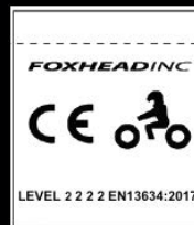
EXEMPLU DE ETICHETĂ CE

Aceste cizme sunt destinate a fi purtate de către motocicliști off-road. Cizmele MX au rolul de a oferi protecție împotriva condițiilor ambientale, fără a afecta în mod nejustificat dexteritatea utilizatorului de a controla motocicletă și a acționa comenzile de picior. Ele au de asemenea rolul de a oferi gleznei piciorului un anumit grad de protecție mecanică în caz de accident. Cizmele pentru motocros nu sunt destinate a proteja împotriva căderilor datorită alunecării. Aceste cizme au fost testate și certificate conform standardului european 13634:2017 (nivelul 1 2 2 2)