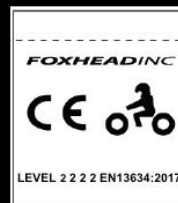
EKSEMPEL PÅ CE-MÆRKE

Disse støvler er designet til off-road motorcyklister. MX støvler er beregnet til at yde beskyttelse mod forholdene i terrænet uden unødvendig forringelse af brugerens bevægelsesfrihed til at styre motorcyklen og betjene fodpedalerne. De er også beregnet til at yde en vis grad af mekanisk beskyttelse til anklen i tilfælde af uheld. Motocross-støvlen er ikke beregnet til at beskytte mod fald som følge af en udskridning. Disse støvler er prøvet og certificeret i henhold til Europæisk Standard 13634:2017 (Niveau 1 2 2 2)