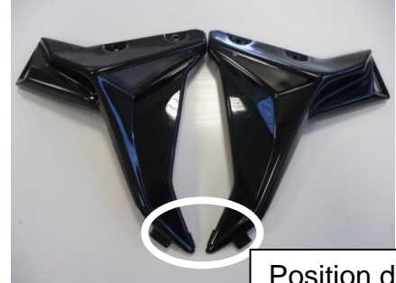
Position des Kantenschutzes