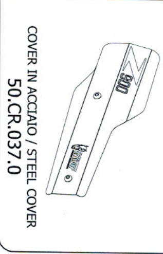
COVER IN ACCIAIO / STEEL COVER 50.CR.037.0