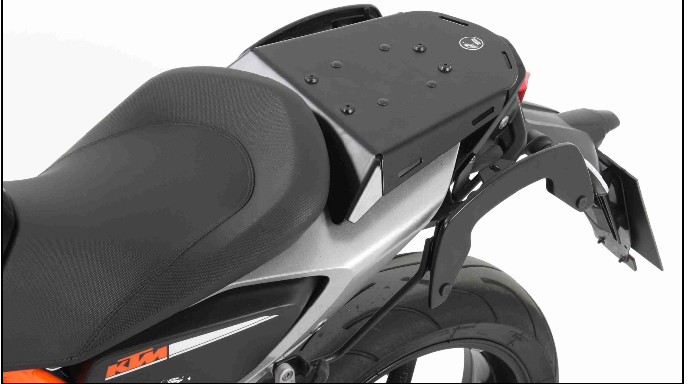
Bild zeigt als weiteres Zubehör den C-Bow Softtaschenhalter

Anzugsmomente des Motorradherstellers beachten! Nach der Montage alle Verschraubungen auf festen Sitz kontrollieren! Bitte beachten Sie unsere beigefügten Serviceinformationen.