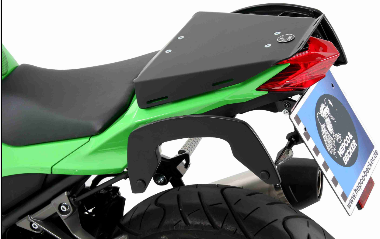
Bild zeigt als weiteres Zubehör den C-Bow Softtaschenhalter

Anzugsmomente des Motorradherstellers beachten! Nach der Montage alle Verschraubungen auf festen Sitz kontrollieren! Bitte beachten Sie unsere beigefügten Serviceinformationen.