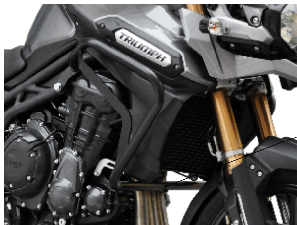
Ansicht von vorn rechts