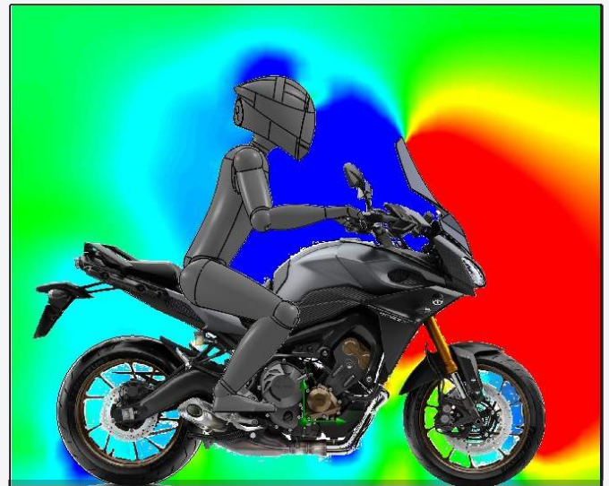
PUIG SCREEN RESULTS