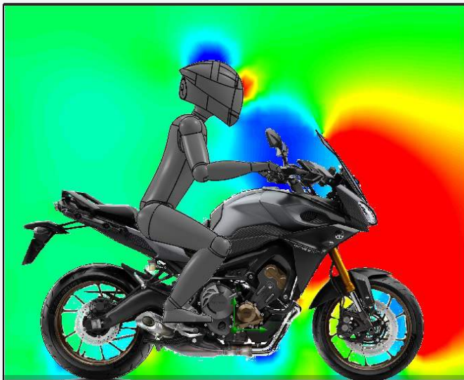
ORIGINAL SCREEN RESULTS